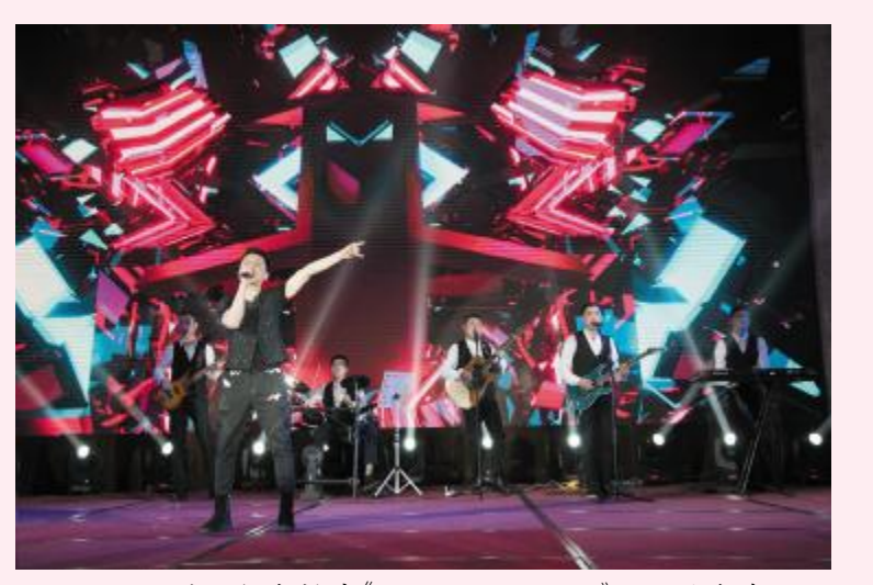
乐队组合摇滚《we will rock you》——渔龙会酒吧