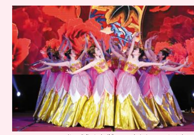
舞蹈《盛世欢歌》——洋沙湖国际旅游度假区