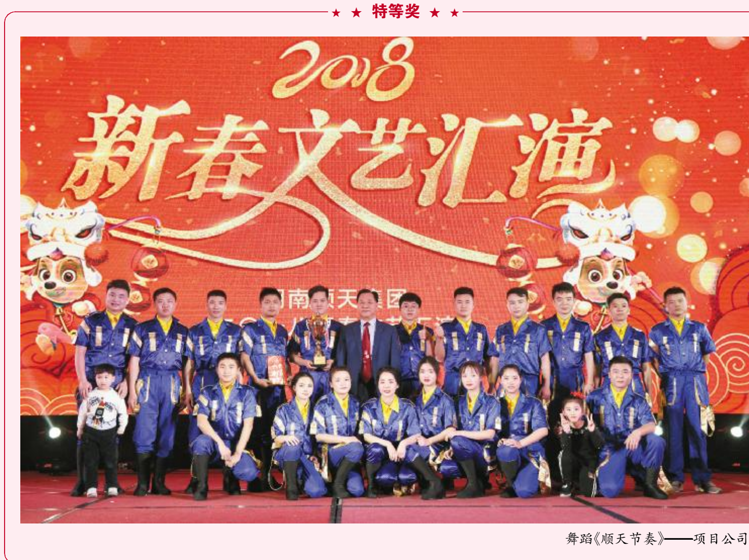
舞蹈《顺天节奏》——项目公司