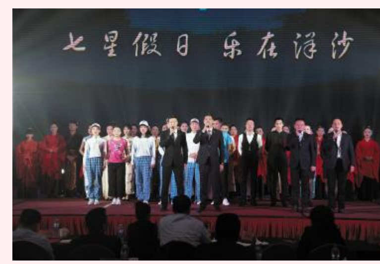
服装礼仪表演《礼仪之邦》——洋沙湖国际旅游度假区