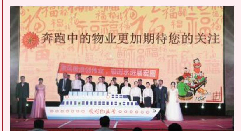
朗诵《顺天心,物业梦!》——物业公司