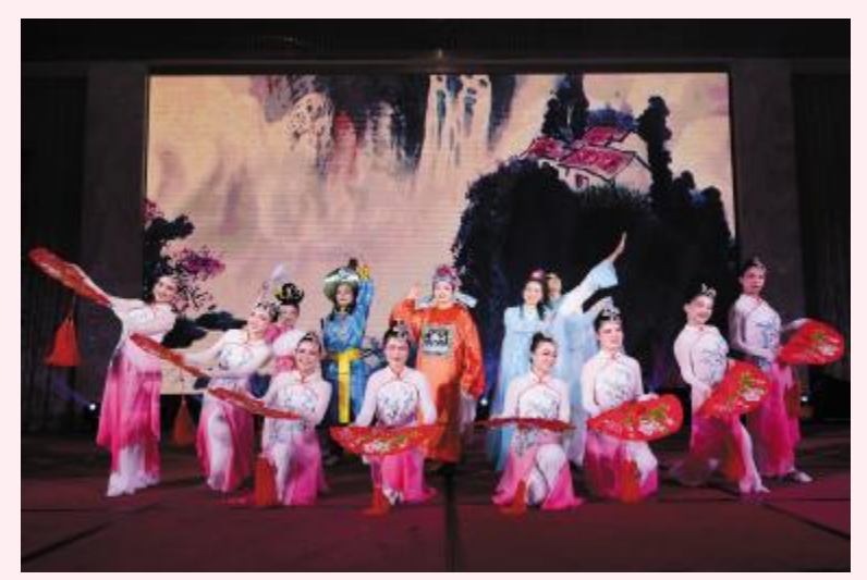
舞蹈戏曲《新式戏曲联唱》——黄金海岸酒店