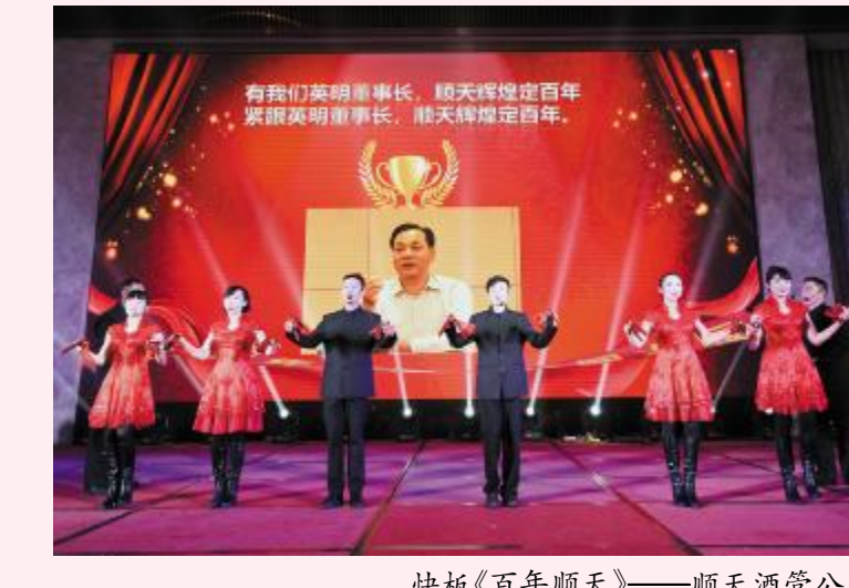
快板《百年顺天》——顺天酒管公司