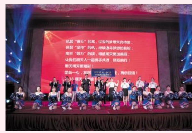
有氧舞《顺天加油》——房产公司