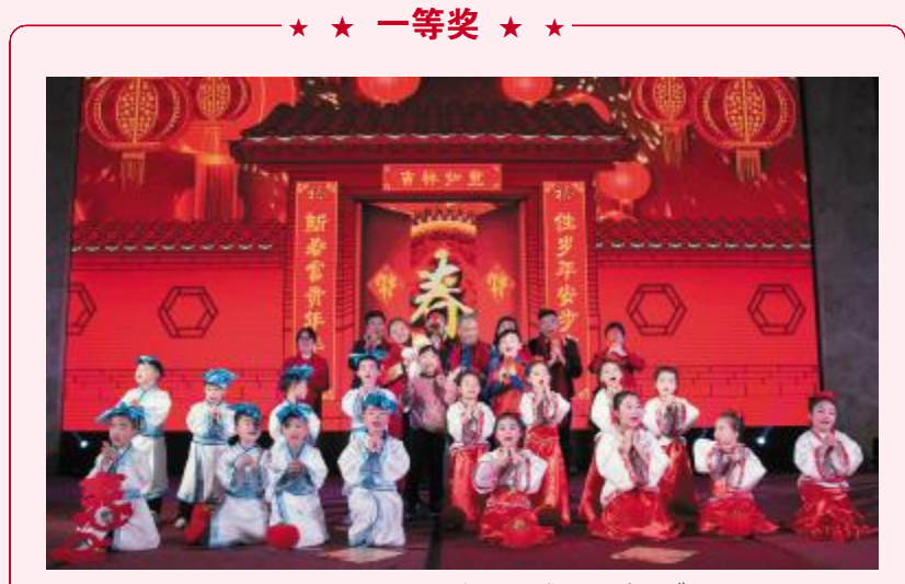
歌舞情景剧《中华孝道》——建设公司