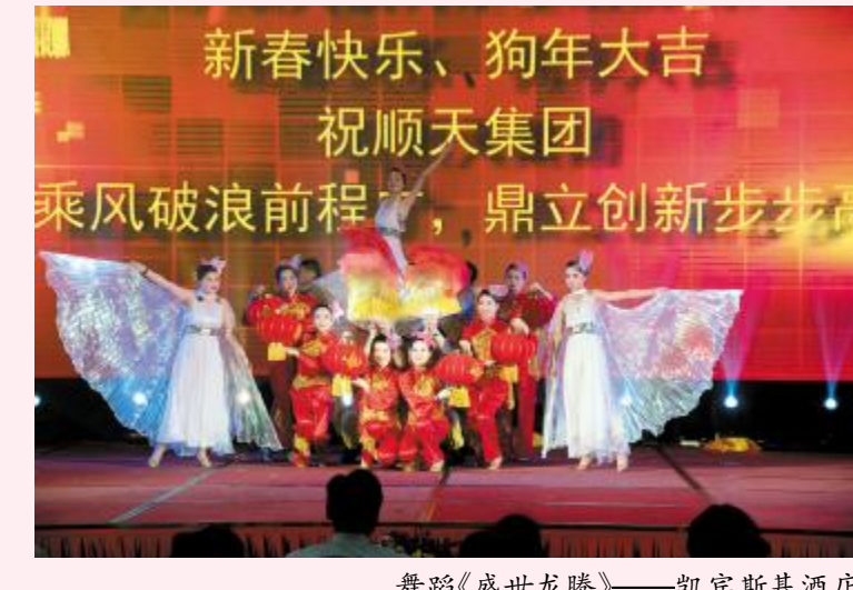
舞蹈《盛世龙腾》——凯宾斯基酒店